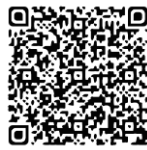
คำพิพากษา

ปี ๒๕๖๑ ศาลอาญาคดีทุจริตและประพฤติมิชอบภาค ๖ พิเคราะห์แล้วเห็นว่าการกระทำของข้าราชการหน่วยงานของรัฐนั้น เป็นการใช้อำนาจในตำแหน่งโดยทุจริต อันเป็นการเสียหายแก่สำนักงานอันเป็นความผิดตามประมวลกฎหมายอาญามาตรา ๑๕๑ จึงพิพากษาให้ลงโทษจำคุก ๕ ปี (คดีหมายเลขดำที่ อท.๑๒/๒๕๖๑ คดีหมายเลขแดงที่ อท.๓๓/๒๕๖๑)