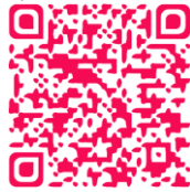
ประมวลจริยธรรม

เพื่อให้เป็นไปตามความในมาตรา ๒๗๙ ของรัฐธรรมนูญแห่งราชอาณาจักรไทย พุทธศักราช ๒๕๕๐ ประกอบค่านิยมหลักสำหรับผู้ดำรงตำแหน่งทางการเมืองและเจ้าหน้าที่ของรัฐอันผู้ตรวจการแผ่นดินได้ให้คำแนะนำให้หน่วยงานทั้งหลายถือปฏิบัติ ก.พ. โดยความเห็นชอบของคณะรัฐมนตรีจึงกำหนดมาตรฐานทางจริยธรรมขึ้นเป็นประมวลจริยธรรมข้าราชการพลเรือน เพื่อให้ข้าราชการทั้งหลายเกิดสำนึกถึงซึ่งและเที่ยงธรรมในหน้าที่ผดุงเกียรติ และศักดิ์ศรีข้าราชการควรแก่ความไว้วางใจและเชื่อมั่นของปวงชนและดำรงตน ตั้งมั่นเป็นแบบอย่างที่ดีงามสมกับความเป็นข้าราชการในพระบาทสมเด็จพระเจ้าอยู่หัว ผู้ทรงเป็นตัวอย่างแห่งธรรมจรรยาอันสูงสุดเพื่อใช้บังคับเป็นมาตรฐานกลางไว้